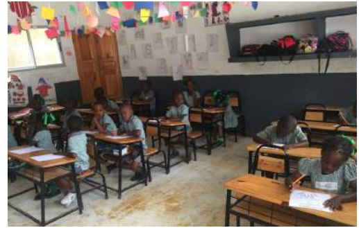
Salle de classe

Quelques activités ont également été organisées, comme la mise en place d'une « journée couleurs »