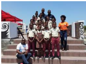
Délégation de l'école – Remise des livres

Quelques activités ont également été organisées, comme la mise en place d'une « journée couleurs »