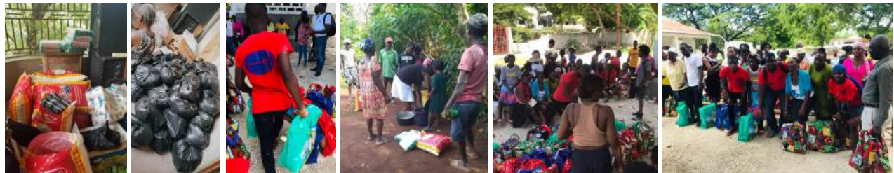
Distribution dans la zone sinistrée par le séisme

Avec les fonds mis à disposition par Action Avenir Haïti , les membres du Platinum Club ont acheté des produits alimentaires et sanitaires, ainsi que du matériel scolaire, qu'ils ont ensuite acheminés par bus d'une part vers la ville de St. Louis du Sud, près de Les Cayes, au sud-ouest de Port-au-Prince et d'autre part à Pestrel du côté de Jérémie dans le département Grand'Anse. Au cours des actions de distribution réalisées, environ 500 personnes sans abri ont pu profiter d'un don de produits de première nécessité tels que huile, pâtes, riz, eau potable, dentifrice, papier toilette, etc.