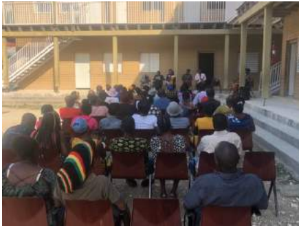
Réunion des parents